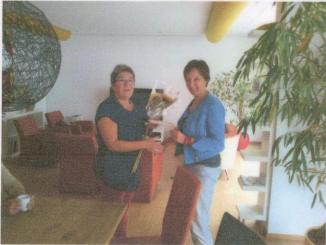
overdracht van cheque ter waarde van € 2.300,-